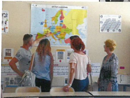
Ecoles maternelle et élémentaire