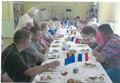
Des moments de partage