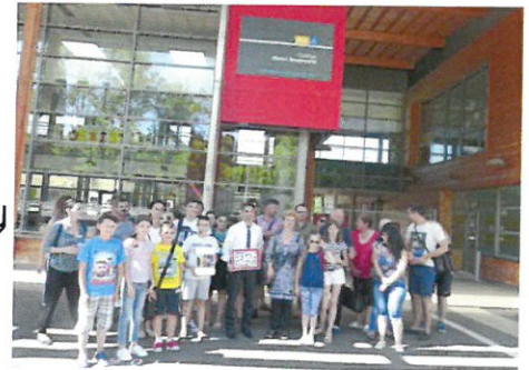
Collège de Châtillon-Coligny