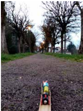
1 er du concours photo catégorie jeune