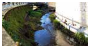
3 ème du concours photo catégorie jeune