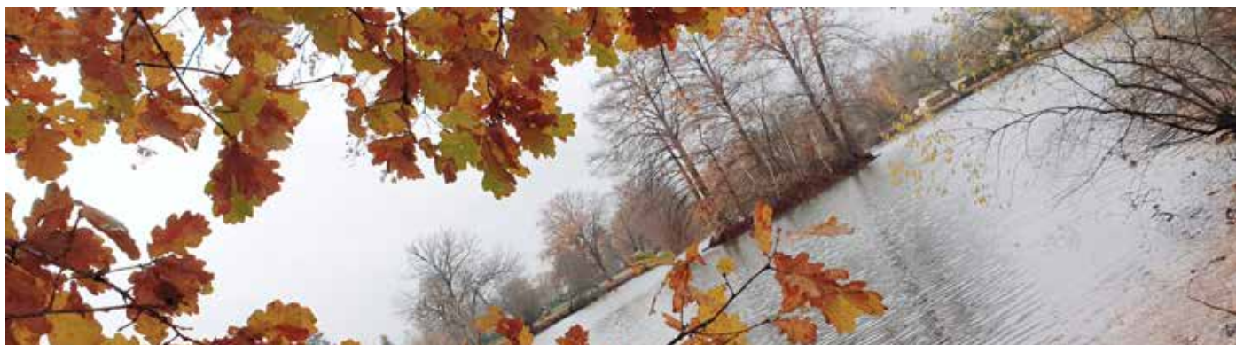
2 ème du concours photo catégorie jeune