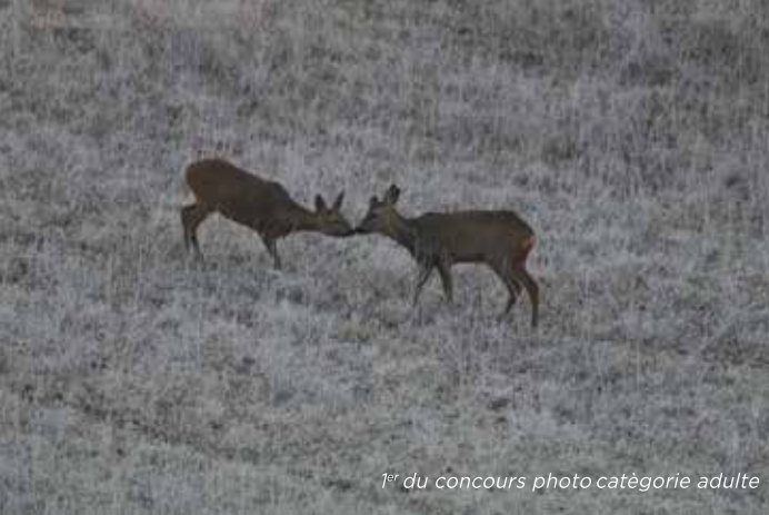
1 er du concours photo catégorie adulte