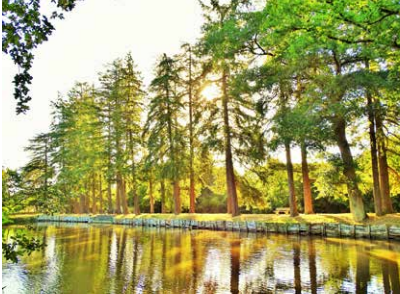
3 ème du concours photo catégorie adulte